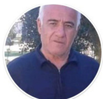
بحث ودراسة الشاعر والكاتب تورجين رشواني

الكتابة وتعرف على شخصيات أدبية كردية مشهورة عالمياً أمثال يشار كمال وكمال طاهر ومحمود مقال و جيتين التان ونزيه مريج وغيرهم، فصار يلماز بين صفوف هؤلاء الكبار وصار كاتباً قصصياً وترجمت رواياته صالبا و ماتوا وأعناقهم ملوية، وقد طبعت صالبا سبع مرات وترجمت الى العربية من قبل فاضل جتكر عام ١٩٨٠ وقد كان قد كتبها في سجن سلمية سنة ١٩٧٣، وكتب يلماز العديد من الروايات والقصص فهذه روايته بعنوان (قصص الى ابني) (نحن نريد مدفاة وزجاجة للنافذة ورغيفين) وكتب أيضاً دراسات أهمها (الشرائع السياسية) و نصف من السجن وقد كتب آخر كتاب وهو في السجن حول الفاشية إضافة إلى هذا كان يكتب السيناريست لكثير من الأفلام،