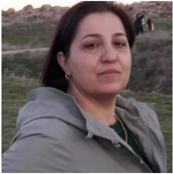
إعداد: ليل قمر

كنت أول متقدمة تعرض عليه أن تشتغل على اللغة الكردية، هذه الأرض البكر، المثيرة للاهتمام. وقد أظهر جيلبير لازارد أنه مشرف ممتاز.. وتضيف جويس (.. عندما قررت عام ١٩٦٧، في غمرة الحرب بين الثوار الكرد والحكومة العراقية، أن أذهب إلى كردستان العراق لكي أحصل على المادة اللغوية لأطروحتي، لقيت كل التشجيع. لم أكن الأولى. فقد سبقني إلى هناك عالم موسيقي فرنسي شاب يدعى جورج دريون برفقة زوجته في مغامرة لجمع الموسيقى البيزيديّة، لكن وجودهما لم يعجب السلطات فقامت بطردهما خارج البلاد. ثمة شباب فرنسيون آخرون غامروا بالذهاب إلى هناك، لكن لن أذكر منهم سوى أصدقائي فرانسوا كزافييه (مصوّر وصانع عدة البومات لكردستان العراق) و جان بيرتولينو (مخرج سينمائي وصانع عدة أفلام وثائقية عن الكرد) و جان براديبه (أستاذ المستقبل في السوربون) و برنار دوران (أحد سفراء المستقبل لفرنسا) وكذلك الصحفي والاختصاصي الكبير في شؤون الشرق الأوسط إريك رولو وزوجته روزي وآخرون.